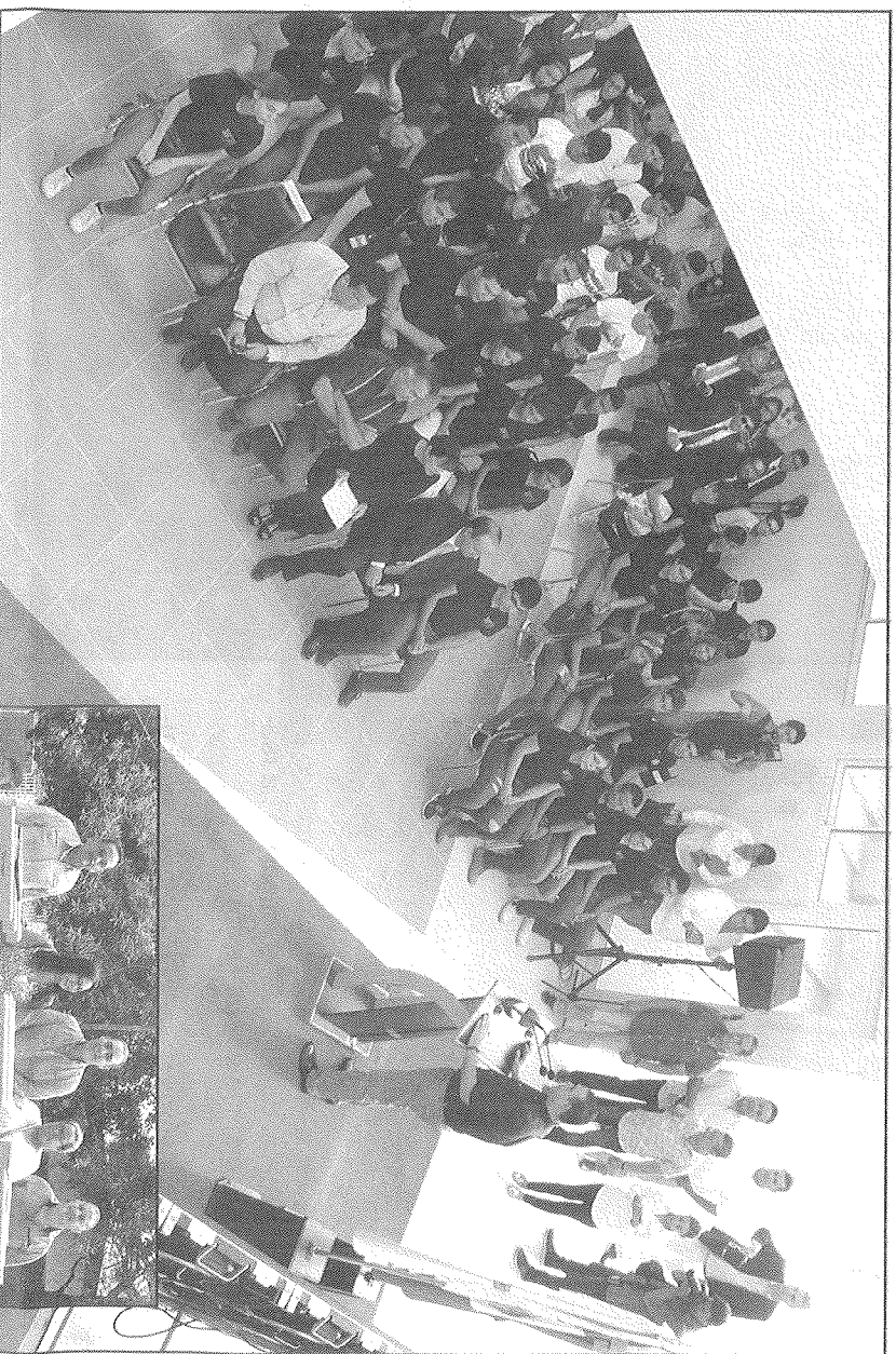
González Treviño, donde a petición de padres de familia se está construyendo de dicho techado.

Por otra parte, también dio inicio al seminario Cero Tolerancia a la Violencia contra la Mujer, acompañado de la presidenta ejecutiva del Institu-